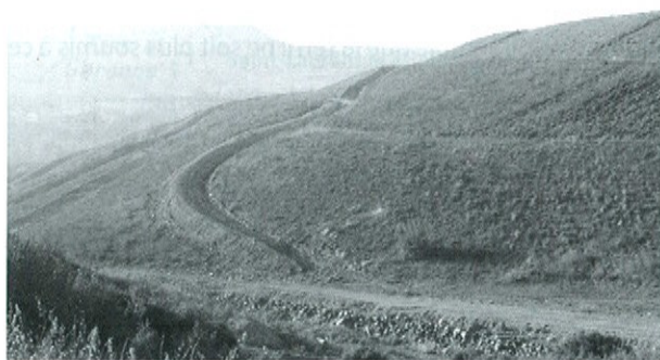
Photo 2. Une vue des deux niveaux des Plages de l'Artus.

Le site de Sentein (09, Photo 3) est un site orphelin, dont la gestion et la mise en sécurité incombe donc à la DRIRE. Les interventions de Mica Environnement pour la mise en sécurité du site se sont étalées sur