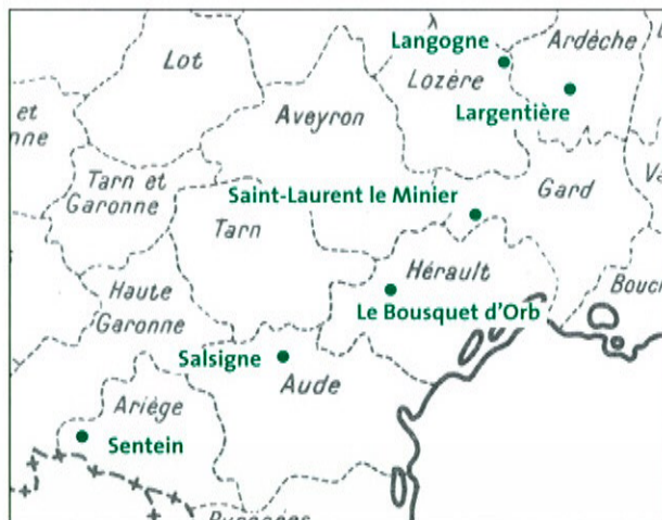
Figure 1. Localisation de sites mentionnés dans le texte.