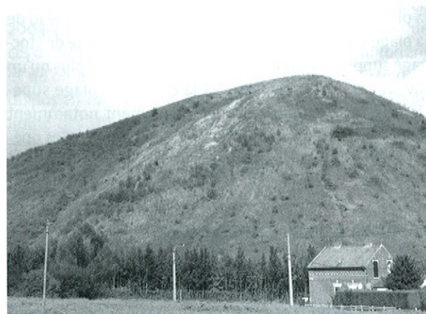
Photo 1. Le terril 14 dans son contexte.

maîtrise d'œuvre, études hydrogéologiques et hydrologiques, études géotechniques de stabilisation, etc. ;