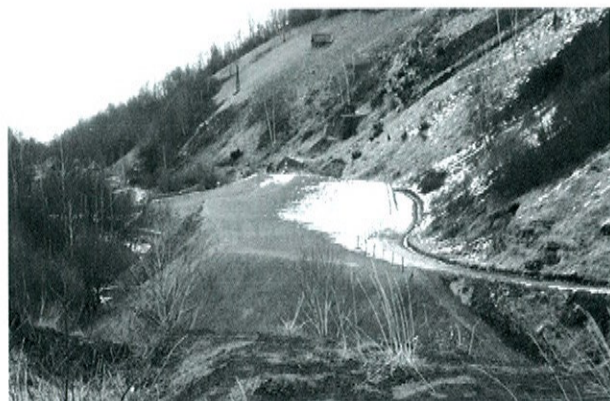
Photo 3. Vue générale du site de Sentein.

la période 2001-2005. La première phase en 2001 a porté sur la reconnaissance du site et la définition d'un programme de travaux, ce qui a impliqué une large concertation avec tous les acteurs impliqués (Office nationale des forêts, ONF, Montagne, Direction régionale de la culture, commune, etc.). La présence d'une grotte protégée a été un élément de complication.