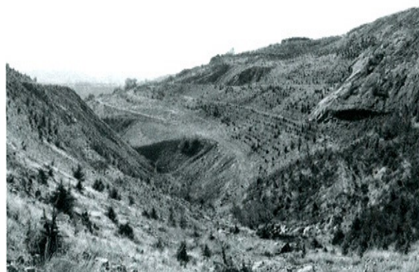
Photo 5. Vue générale du réaménagement du Bousquet d'Orb.

Au Bousquet d'Orb, globalement, les principes d'origine ont été respectés et le dispositif par banquettes a largement fait ses preuves, ce qui a conforté son emploi dans de nombreuses autres configurations. La végétalisation d'un semis herbacé, directement après les travaux de terrassement, a permis la fixation rapide des sols. Après 10 ans, un sol s'est constitué et le site a ensuite été colonisé naturellement par les espèces présentes dans les bois environnants.