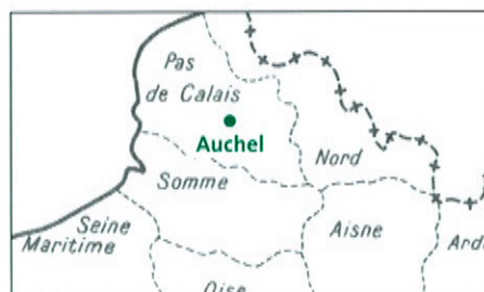
Figure 2. Localisation du terril 14.

Le premier risque est celui de combustion et il a donné lieu à des levés thermographiques infrarouge par les Charbonnages de France, entre 1994 et 2003. Aujourd'hui, il semble que le terril ne soit plus soumis à ce